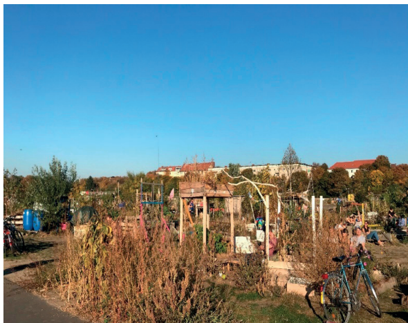
Figura 2. – Allmende-Kontor presso Tempelhofer Feld. Fonte: scatto di Sara Giovansana, 13 ottobre 2018.

In tempi di globalizzazione e gentrification , l'omogeneizzazione delle pratiche di consumo e di vita quotidiana si accompagna all'assottigliamento delle disparità tra abitanti locali e visitatori (Vives Miró 2011), al punto che gli ultimi indossano sempre più le vesti dei primi, tanto da essere definiti post-tourist o new urban tourist (Cocóla-Gant 2015). Tale evoluzione implica una full immersion nella realtà locale da parte del turista, che arriva così a spingersi anche verso punti di attrazione e luoghi d'interesse meno mainstream (Gotham 2005; D'Eramo 2017; Gravari-Barbas and Guinand 2017; Gavinelli e Zanolin 2019). Di tale fenomeno, i giardini urbani simbolo della Berlino eco-minded sono un esempio degno di nota.