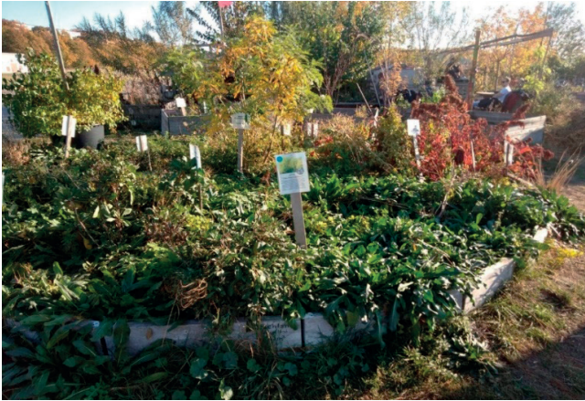
Figura 3. – Coltivazioni ad Allmende-Kontor presso Tempelhofer Feld. Fonte: scatto di Sara Giovansana, 13 ottobre 2018.