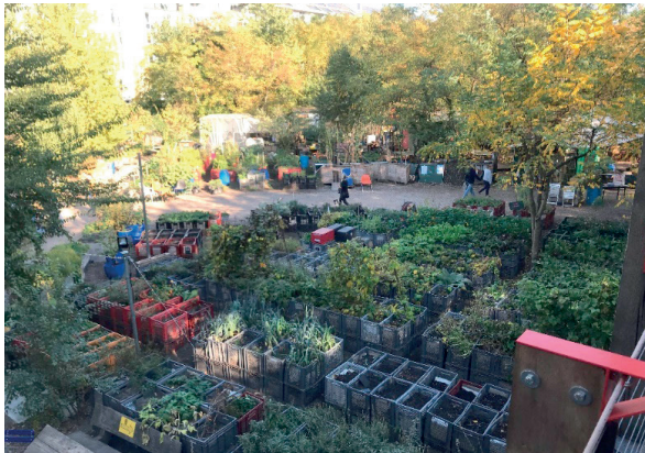
Figura 1. – Prinzessinnengärten.

Anche l' urban greening sembra aver dato un contributo attivo al trend : tra i 9 soggetti presi a campione presso i Prinzessinnengärten (Fig. 1), 4 sono austriaci e bavaresi; mentre nel caso dei giardini di Allmende-Kontor presso il Tempelhofer Feld (Fig. 2), gli intervistati non di origine berlinese (bensì danese e olandese) sono 9 su 14.