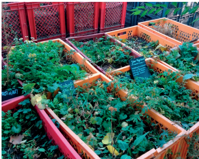
Figura 4. – “Letti rialzati” presso Prinzessinnengärten. Fonte: scatto di Sara Giovansana, 13 ottobre 2018.

guono continui atti di protesta. Su quest'ultimo punto, in particolare, si aprono nel caso dei Prinzessinnengärten scenari che corrispondono sia a interessanti spunti di riflessione sia a gravose minacce per il futuro stesso dei giardini urbani, mettendo a rischio l'ottimale perseguimento degli obiettivi prefissati e la buona riuscita dei progetti territoriali.