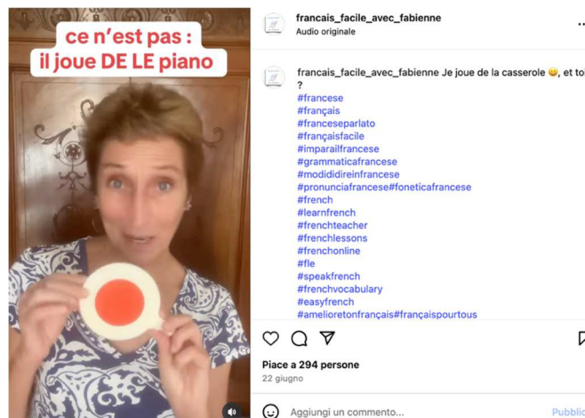
Figure 4 : Exemple de contenu du compte @francais_facile_avec_fabienne abordant les expressions idiomatiques (vidéo publiée le 17 février 2025)