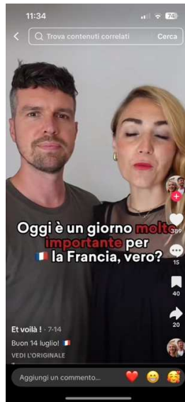
Figure 6 : Exemple de contenu à caractère culturel du compte @et_voila_voila (vidéo publiée le 14 juillet 2025)

Le créateur des comptes @camillecarissimo (Instagram) 14 et @camillessimo (TikTok) a commencé à publier des contenus didactiques initialement sur TikTok, en septembre 2022 ; sur Instagram, le compte analogue est apparu plus tard, précisément en novembre 2024.