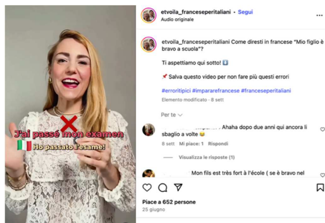
Figure 5 : Exemple de contenu sur les erreurs fréquentes chez les Italiens sur le compte @etvoila_franceseperitaliani (vidéo publiée le 25 juin 2025)

Leur approche repose également sur la comparaison entre italien et français : mots dont le genre diffère entre les deux langues, faux amis, termes intraduisibles ou difficiles à rendre en italien, erreurs fréquentes chez les apprenants italophones (Figure 5), etc. La grammaire y occupe une place marginale ; les contenus se concentrent principalement sur la langue courante et le lexique. Un espace résiduel, mais néanmoins significatif, est consacré à la prononciation. L'aspect culturel joue également un rôle important, comme en témoignent non seulement les vidéos publiées – la fête nationale (Figure 6), la Fête de la Musique du 21 juin, le langage des SMS, entre autres –, mais aussi la création d'un podcast intitulé Un jour en France , consacré à la langue et à la culture françaises à travers des faits et thématiques variés.